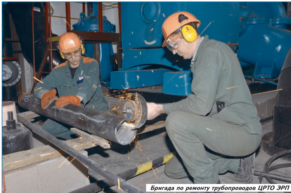
Бригада по ремонту трубопроводов ЦРТО ЭРП

21 марта 2012 года на Южно-Украинской АЭС стартовала ремонтная кампания.