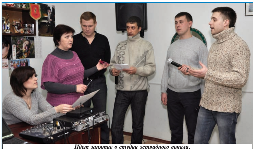
Идет занятие в студии эстрадного вокала.